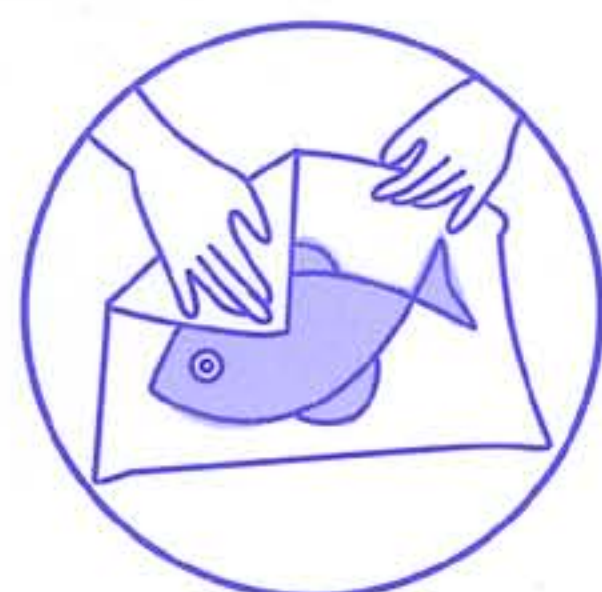
生鮮品・野菜の 鮮度保持に