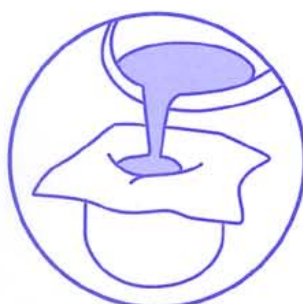
油・出し汁こしに